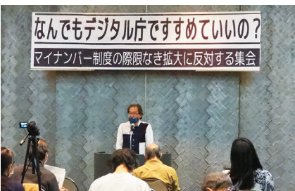
マイナンバー制度の際限なき拡大とデジタル化強化を問う集会(2020年11月21日)

勝手に番号を付けて本人同意もなく行政機関等が個人情報を利用するマイナンバー制度は、憲法に保障されたプライバシー権を侵害すると、利用差止を求め全国8ヶ所で裁判中です。個人情報の収集・利用・保存・提供を本人の同意により行うという自己情報コントロール権(情報自己決定権)は世界の常識です。しかし、国は自己情報コントロール権を憲法で保障された権利ではないと主張し、各地裁もそれを認めて不当な合憲判決を下しました。裁判は一審判決を不服として控訴し高裁で争われています。このような政府がすすめる個人情報の共有と利活用拡大を認めることはできません。